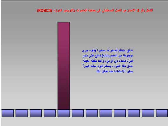
الشكل رقم 4: الامتار من الحمل المنقضي في جمعية المدخرات والقروض الدوارة (ROSCA)