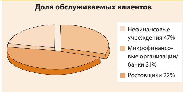
Схема 2 Процент клиентов, обслуживаемых нефинансовыми организациями в Сальвадоре